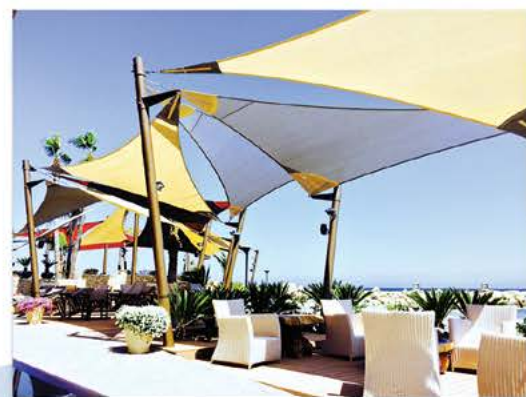
Amathus Limanaki Tavern

Είναι η ιδανική λύση για σκιάστρα αυτοκινήτων, σκαφών, αθλητικών χώρων και εκπαιδευτικών ιδρυμάτων, πισίνων, εξωτερικών χώρων εστίασης και αναψυχής