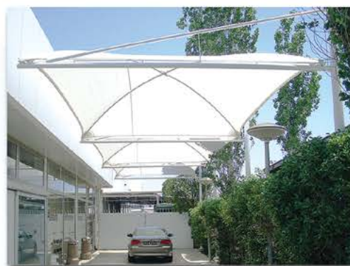
Carports - BMW Pilakoutas