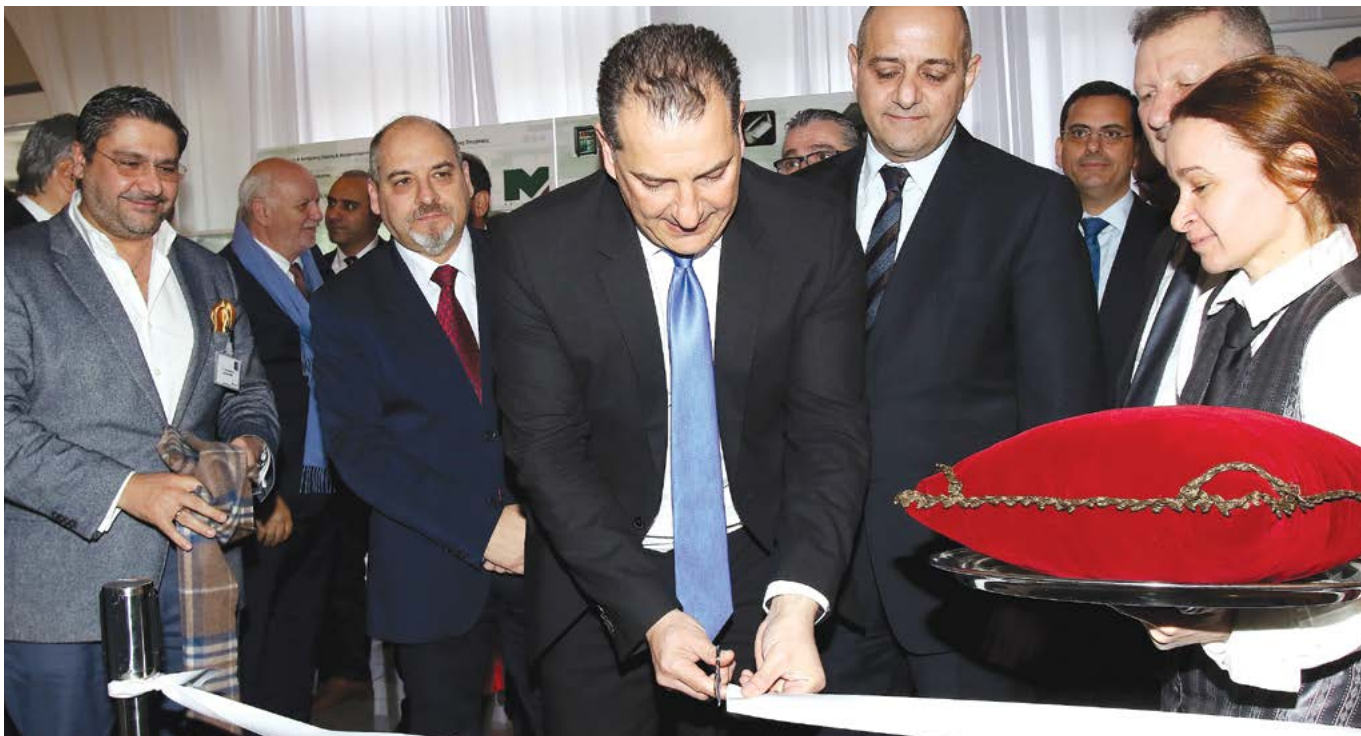
Ο υπουργός Ενέργειας, Εμπορίου, Βιομηχανίας και Τουρισμού Γιώργος Λακκοτρύπης τελεί τα εγκαίνια της Έκθεσης Προϊόντων & Υπηρεσιών.