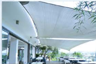
Santa Marina Retreat